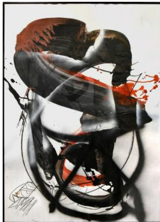
SAMA L'éveil comme instance donatrice pure Exposition au château de Bouc-Bel-Air. 2018.