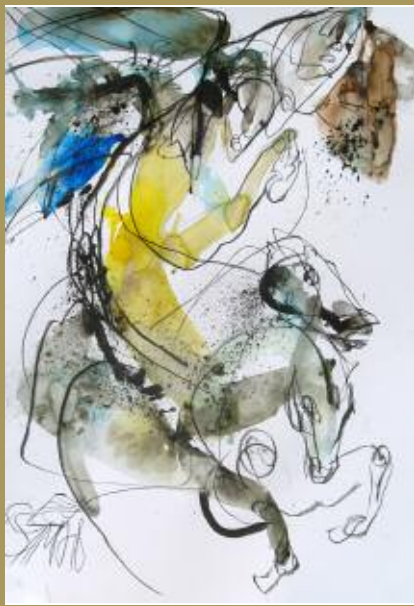
Ange chevalier. Dessin.