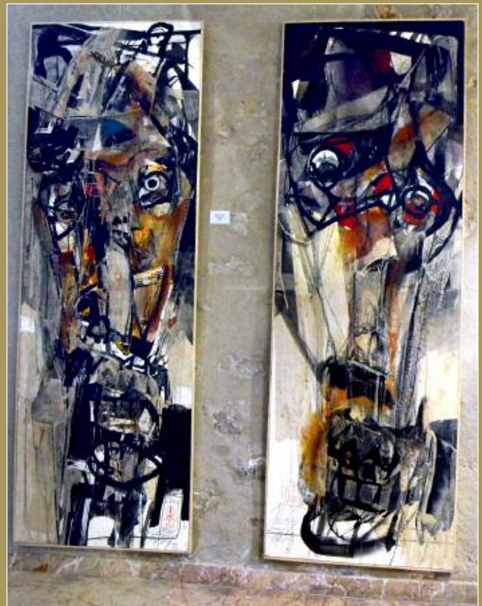
Gueules cassées. 2012.