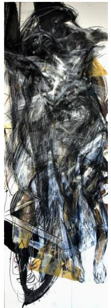
SAMA Présence Exposition au château de Bouc-Bel-Air. 2019. Avec le sculpteur Pierre Pellizon.