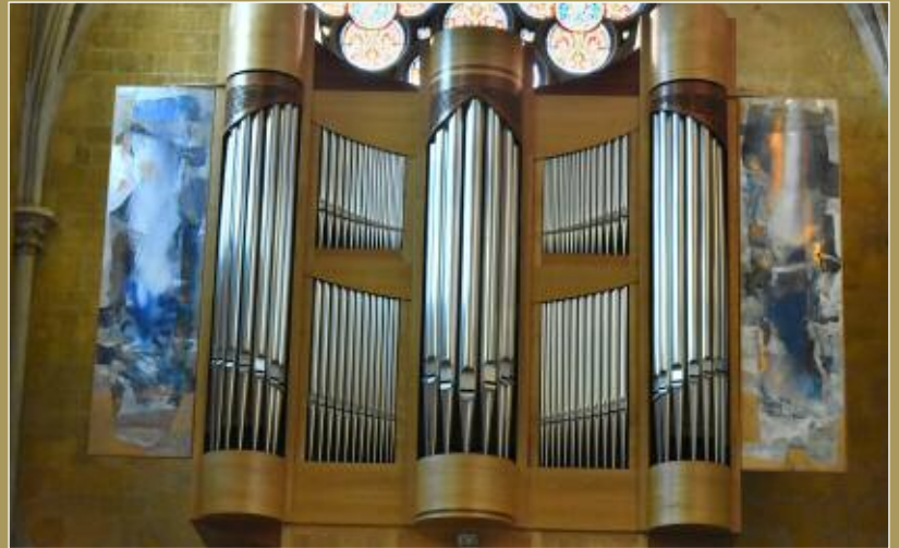
Panneaux d'encadrement du buffet d'orgues. Église Saint-Jean-de-Malte. Aix-en-Provence.