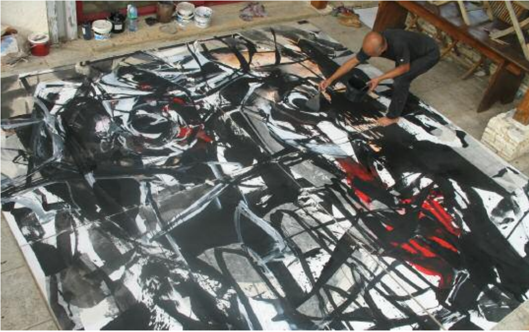
Préparation de l'exposition de Montluçon. 2011.