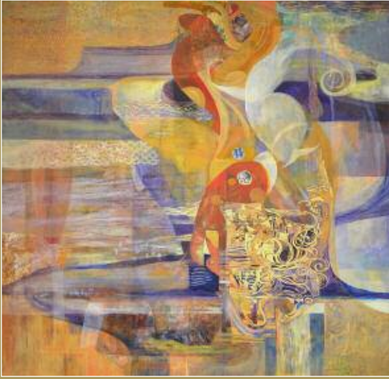
Entre 1975 et 1980.