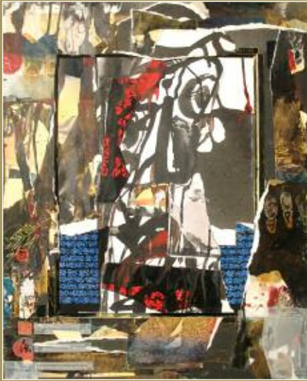
Petit format. 2010.