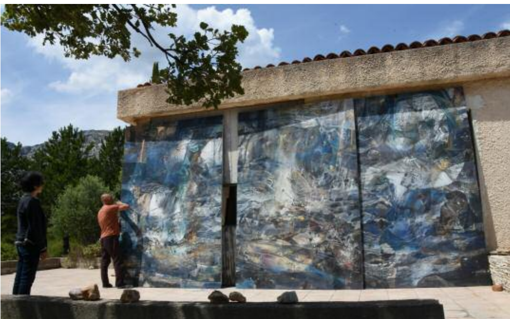
Triptyque. Puylobier. 2020.