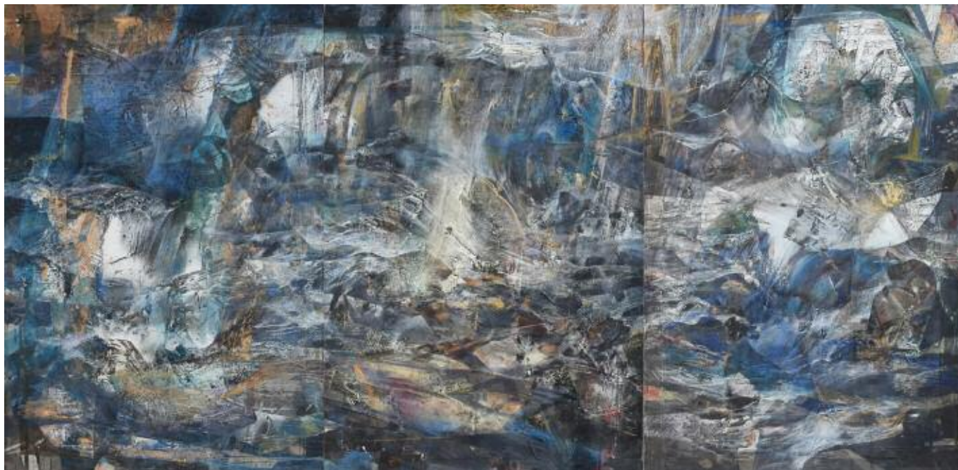
Triptyque. L 6 m x H 3 m (3 fois 2 m x 3 m).