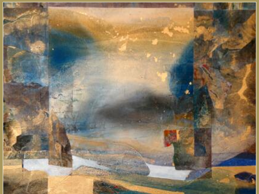
Début années 2000.